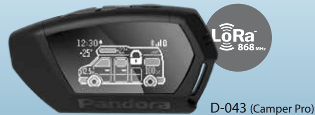
D-043 (Camper Pro)

Diese Option ist auch für das Pandora Camper-System verfügbar